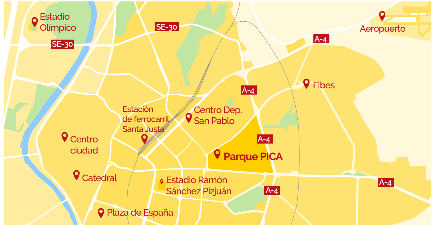
Ubicación del Parque PICA en la ciudad.

E l PICA fue apodado por muchos como 'el Polígono Industrial del centro de Sevilla'. Obviamente eso es debido a la excelente ubicación de la que goza. Frente a uno de los centros comerciales más emblemáticos de la ciudad como 'Los Arcos' y dando la bienvenida a todos los que llegan a Sevilla a través de la A-92 o la SE-30. Además, en los últimos años con la mejora del paso subterráneo en el cruce de la Avenida de Andalucía y la Ronda del Tamarguillo, se ha solucionado un problema que ahora permite mejores accesos a dos de las principales avenidas de la ciudad y al propio PICA.